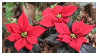
KUKKA LAHJAKSI ALUEEN YKSINÄISELLE VANHUKSELLE (Tämä kalenteri on muokattu ja lisätty Espoon kaupungin Kauklahten kiertokirjassa 2020-2021. Kauklahti-seura yhteistyössä Espoon kaupungin Kauklahten kiertokirjassa 2020-2021. Kuntaliiton Kauklahten kiertokirjassa 2020-2021.)

- oltiin jälleen mukana alueen yksinäisille vanhuksille nyt viidettä kertaa järjestetyssä joulukukkien lahjoituskampanjassa